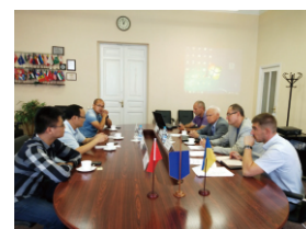
在乌克兰国立科技大学合作洽谈

浙江工业大学从2004年开始与乌克兰国立科技大学开展科技合作，通过十余年时间的积累，已获得丰硕成果，引进的激光制造团队成员入选了国家外专千人计划、浙江省外专千人计划，获得了国家友谊奖、浙江省西湖友谊奖等，联合研制的激光增材制造与再制造专用装备与工艺技术已成功应用于轮机装备、工模具和石化装备中。通过此行的交流洽谈，进一步拓展了浙江工业大学与乌克兰高校和科研院所合作的广度和深度。