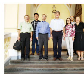
在利沃夫国立理工大学合作洽谈