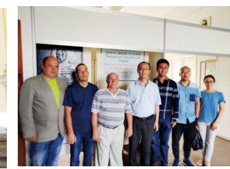
在乌克兰国家科学院金属材料研究所进行学术交流和洽谈

弗拉季米尔·科瓦连柯十分看好两国之间在科技领域开展“开放、合作”，“我认为开放合作是非常重要的，如果没有‘开放、合作’就很难发展各种学科，因为开放合作才会使学科进一步发展。”他表示。